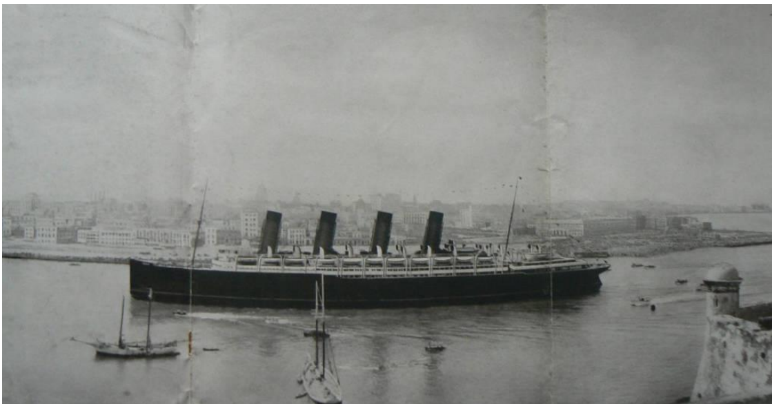
El Mauritania entrando en el puerto de La Habana, alrededor de 1930.

José no ha llegado, sin embargo, sin ambiciones. Su espectacular entrada en Malleza con un flamante Hispano-suiza y su mejor traje tiene como propósito encontrar a la mujer más bella de la zona. Así se lo hace saber a Don Sabino, médico de la localidad, que transmitirá a Radis que considera a José una gran oportunidad para María Luisa, que quizá verá en su partida a Cuba una salida honrosa y una liberación al dolor que le ha causado su separación de Fernando Aguirre. A pesar de lo precipitado de la proposición de José, los Álvarez Bohem consienten en casar a su hija al constatar que el indiano se ha enamorado de ella. Saben, por supuesto, que María Luisa no lo ama, pero José, siempre bien dispuesto y luchador, confía en conseguir que eso cambie, y los padres de la bella María Luisa sólo desean pasar página y mejorar su situación.