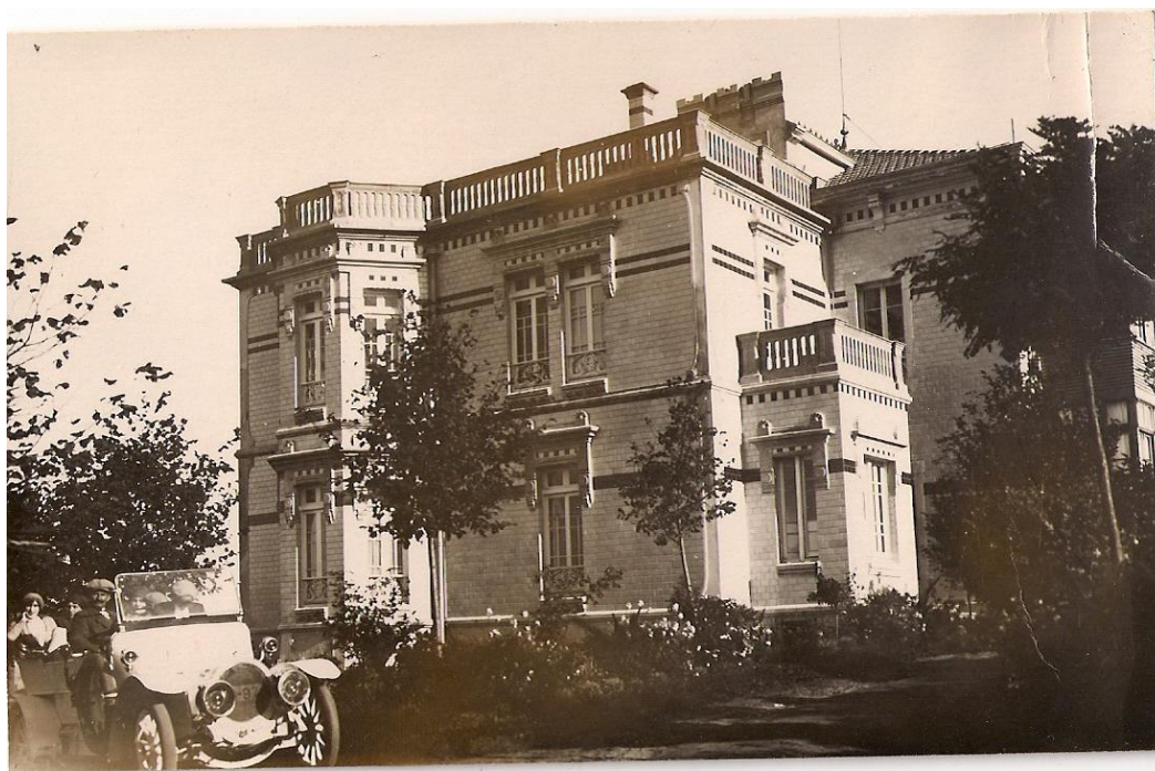
Villa Radis, Malleza.

Con un sentido estético preciso y comedido, la presentación de María Luisa como una belleza proverbial no se ve desmerecida con la cuidada presentación que de José Rodríguez nos hace la autora, brillante en sus contradicciones y certezas, jugando con ambos al antagonismo, y sosteniendo la trama gracias a Fernando, la otra cara de la masculinidad.