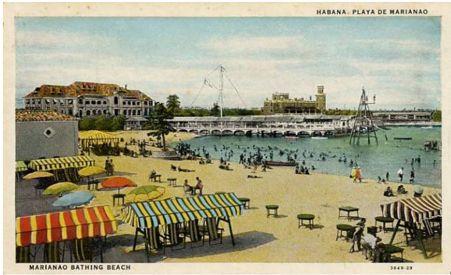
Postal fechada en los años 30 recreando la Playa de Miramar, en barrio Playa, en Marianao.

percibida como fría y distante, hace mella en su autoestima, pero comienza a adaptarse, gracias a la ayuda de los amigos de José en la isla y a la distancia que la separa de Fernando.